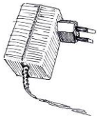
adapter met stekker