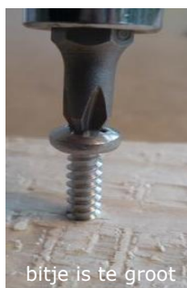
bitje is te groot