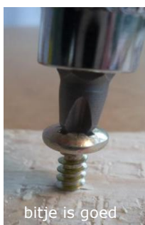
bitje is goed