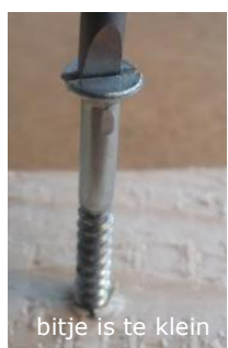
bitje is te klein

1. Zoek het juiste bitje bij je schroef. Kies voor een plat bitje bij een platte schroef (dit is een schroef met een gleuf -) of een kruiskopbitje bij een schroef met een kruiskop (+).