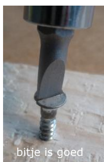
bitje is goed