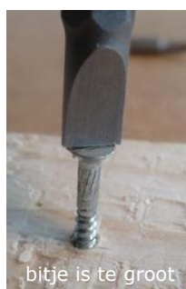
bitje is te groot

2. Let op de goede maat! Met een te klein bitje krijg je de schroef niet rondgedraaid; een te groot bitje past er niet in of pakt niet goed. Hierdoor draai je de gleuf of het kruisje kapot.