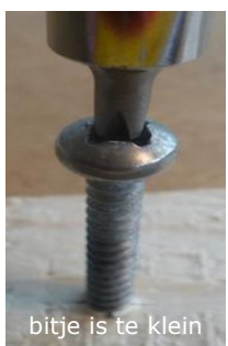
bitje is te klein

2. Let op de goede maat! Met een te klein bitje krijg je de schroef niet rondgedraaid; een te groot bitje past er niet in of pakt niet goed. Hierdoor draai je de gleuf of het kruisje kapot.